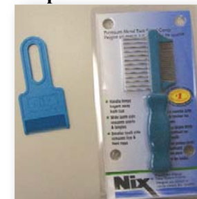
Peignes à poux

Si vous négligez d'enlever ne serait-ce qu'une seule lente, le cycle peut recommencer.