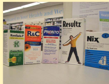
Traitements chimiques contre les poux