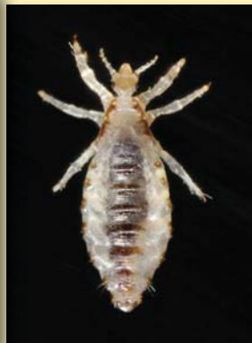
Pou mâle adulte